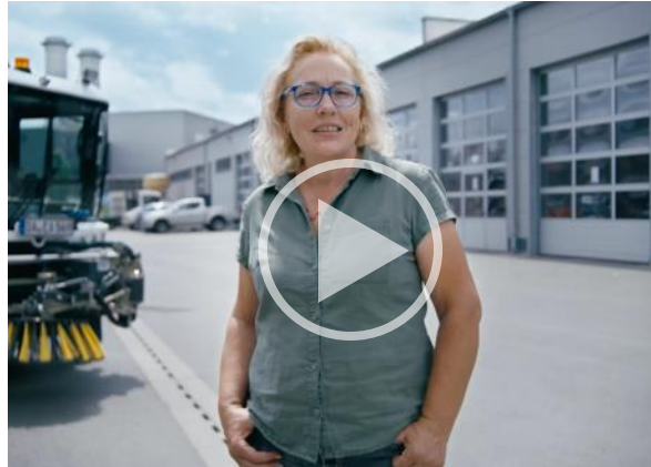
Entsorgung und Stadtsauberkeit